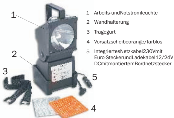
Bild2: Lieferumfang HaloLuxS, Typ4554...