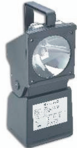
Bild1: HaloLuxS, Typ4554...

Die in nur 4h wiederladbare, spritzwassergeschützte Halogen-Arbeits- und Notstromleuchte aus der AccuLux-Reihe Modell HaloLuxS hat ein Gehäuse aus robustem, schlagfestem Kunststoff. Die HaloLuxS verfügt über einen 120° schwenkbaren Leuchtkopf und ist in ihrer Klasse das Top-Produkt. Es besteht die Schaltmöglichkeit zwischen der 10W Halogenlampe und der LED-Pilotlampe mit Dauer- oder Blinklichtfunktion z.B. als Warnleuchte im Straßenverkehr oder auf Baustellen. Der integrierte Softstart schont die Hauptlampe und verlängert so die Lebensdauer des Leuchtmittels. Der wiederladbare, wartungsfreie Blei-Gel-Akku kann durch das integrierte Ladegerät sowohl an 230V AC als auch an 12/24V DC geladen werden. Der Ladezustand der Leuchte wird durch die rote LED im Leuchtkopf angezeigt. Die Wandhalterung, ein praktischer Tragegurt und zwei unterschiedlichen Vorsatzeinbauten sind im Lieferumfang eingeschlossen. Die HaloLuxS verfügt über einen Überlade- und Tiefentladeschutz, sowie über eine integrierte Fadenbruchererkennung mit automatischer Umschaltfunktion der Haupt- auf die Pilotlampe.